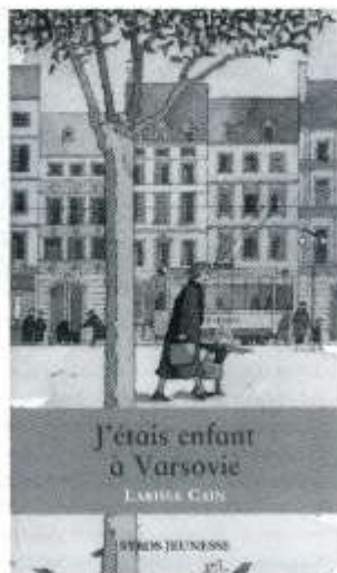
Cain Larissa, J'étais enfant à Varsovie , Syros Jeunesse / VUEF, «Tempo», 2003.

Cronique de la source rouge , Barco-Falcman Berthe, École des loisirs, 1991.