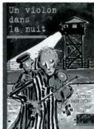
Daeninckx Didier, Pef, Un violon dans la nuit , Les Trois Secrets d'Alexandra 2, Rue du Monde, «Histoire d'Histoire», 2003.