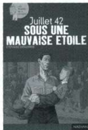
Decornes Stéphane, Juillet 42 sous une mauvaise étoile , Nathan / VUEF, «Les Romans de la mémoire», 2002.