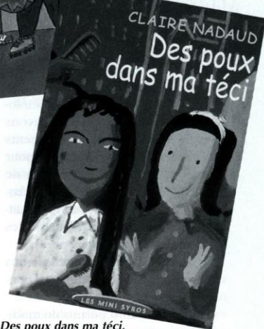
Claire Nadaud, Des poux dans ma téci , Syros, « Mini Souris Sentiments », 1999.